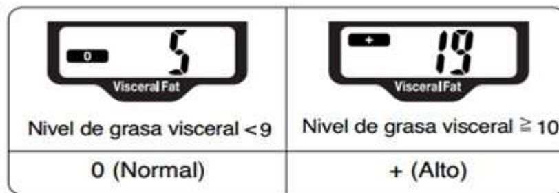
Figura 1. Interpretación del valor estimado de la grasa visceral mediante bioimpedancia eléctrica. Los valores esperados de grasa visceral para un sujeto no obeso, con peso adecuado para la talla, deben ser menores de 10 kilogramos. Para más detalles: Consulte el texto del presente artículo.

Se empleó un nivel del 5% ( p < 0.05 ) para denotar los resultados encontrados como significativos. 54