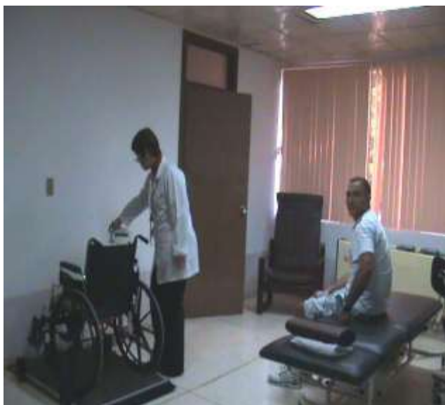
Figura 3. Procedimiento para el registro del peso en un paciente con LME secundaria a trauma raquimedular dorsolumbar

Reconstrucción de la masa muscular esquelética: La masa muscular esquelética (MME) del paciente se reconstruyó a partir de las mediciones antropométricas y la excreción urinaria de creatinina, según ecuaciones matemáticas descritas previamente: