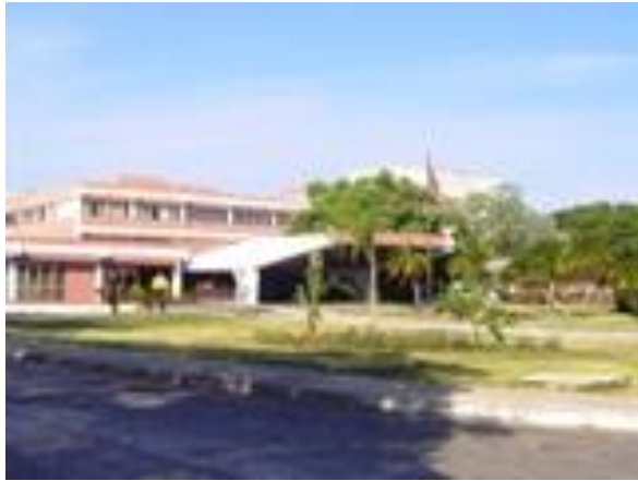
Figura 1. Centro de Investigaciones Médico quirúrgicas de La Habana. Detalle de la portada.