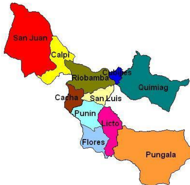
Figura 2. Marco geográfico de la investigación. Parroquias del cantón Riobamba.

Fuentes: Cantón Riobamba. Disponible en: http://es.m.wikipedia.org/wiki/Cantón_Riobamba .