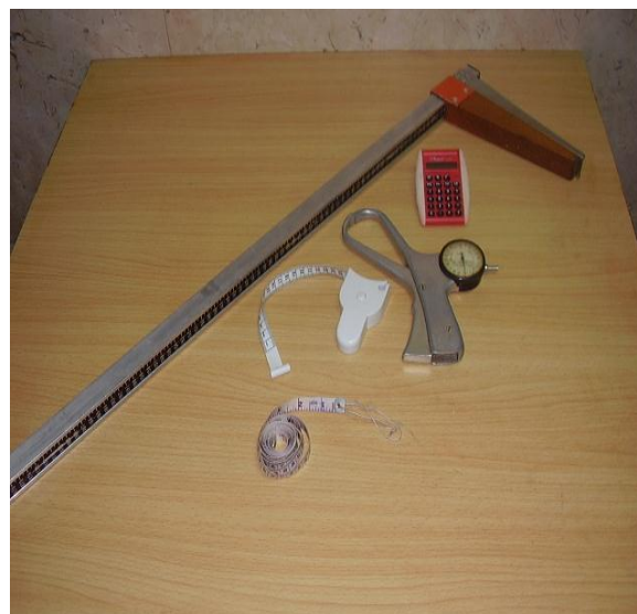
Figura 2. Juego de equipos empleados en la obtención de las variables antropométricas en el paciente hospitalizado, y el cálculo de los metámetros. Se muestran: A la izquierda: una balanza de plato SMIC con tallímetro incorporado (China); A la derecha: un calibrador HOLTAIN (Crymych, Inglaterra), cintas métricas inextensibles, una calculadora de bolsillo, y un antropómetro para la medición de la Altura Talón-Rodilla, construido en el Taller de Prototipos de la institución de pertenencia de los autores.

Se deben satisfacer varios requisitos para la obtención correcta de las mediciones antropométricas: 1) Las mediciones antropométricas se realizarán de preferencia en las horas de la mañana, una vez que el paciente haya defecado y orinado; 2) Se investigará si el paciente deambula libremente, y es capaz de sostenerse por sus propios pies, sin ayuda. En caso de que sea posible, se le pedirá que adopte la Posición Anatómica de Atención para la obtención de las variables antropométricas contempladas en el perfil [PNO 2.013.98: Mediciones antropométricas. Manual de Procedimientos. Grupo de Apoyo Nutricional. Hospital Clínico-Quirúrgico "Hermanos Ameijeiras". Ciudad Habana: 1998]; 3) Se asegurará que el paciente vista la menor cantidad posible de ropa, y