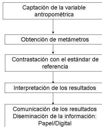
Figura 1. Esquema propuesto para la evaluación antropométrica del paciente hospitalizado.

diferencial de los trastornos de la composición corporal (Sobrepeso y Obesidad/Desnutrición Energético-Nutricional), y calcular el Índice de Excreción de Creatinina (IEC): un metámetro que expresa el estado de la integridad de la masa muscular del sujeto. 3