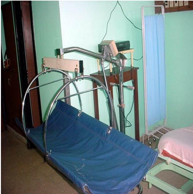
Figura 3. Un prototipo de cama-báscula empleada en la evaluación antropométrica de los pacientes internados en el Hospital Clínico-Quirúrgico "Hermanos Ameijeiras".

antropométrica del paciente hospitalizado para facilitar el rápido completamiento de